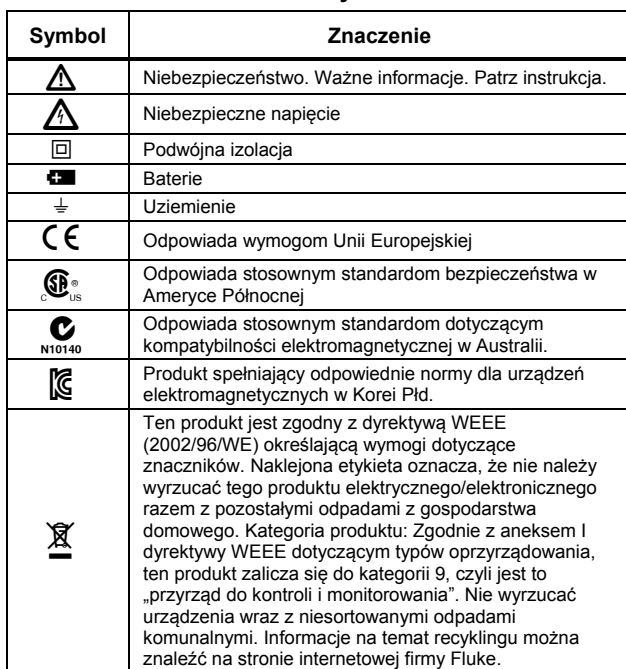
Tabela 1. Symbole